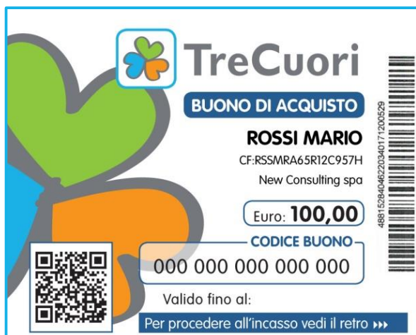
FAC-SIMILE del fronte BUONO TreCuori